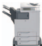
Urządzenie wielofunkcyjne HP Color LaserJet 4730xm mfp

Urządzenie wielofunkcyjne HP Color LaserJet 4730mfp zostało zaprojektowane dla średniej wielkości zespołów roboczych (od 6 do 15 użytkowników) w przedsiębiorstwach oraz dla zespołów roboczych (od 3 do 10 użytkowników) w małych i średnich firmach obsługiwanych przez dział informatyczny, które drukują dokumenty w formacie A4 w czerni i w kolorze i chcą wykorzystać urządzenie wielofunkcyjne do zwiększenia wydajności.