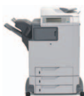
Urządzenie wielofunkcyjne HP Color LaserJet 4730xs mfp